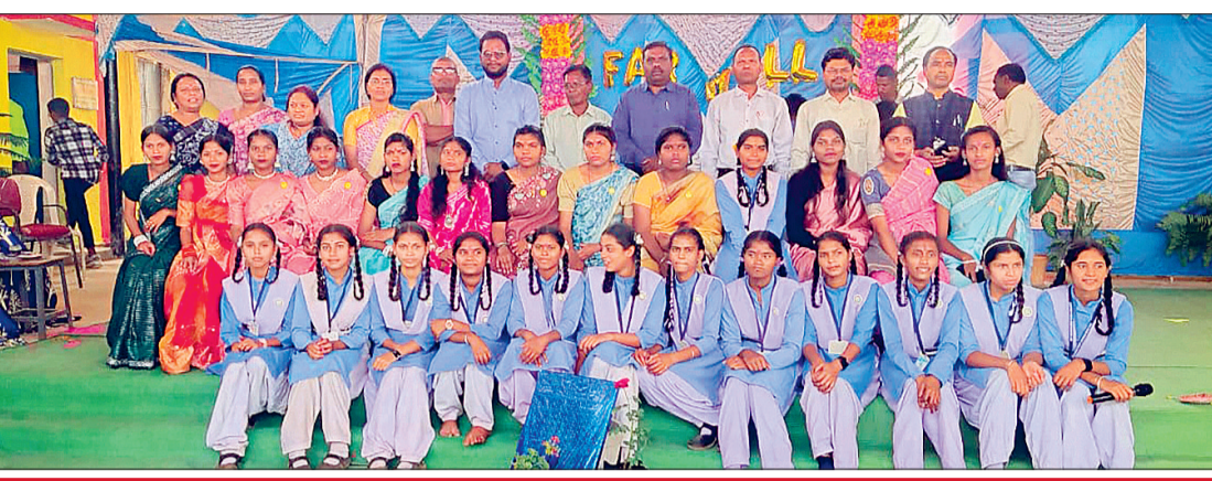
बेलोदी स्कूल की कक्षा 12वीं के छात्रों को दी गई विदाई