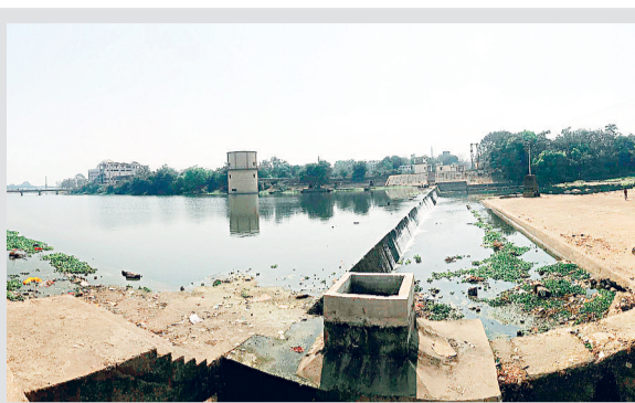
पेयजल संकट से निपटने किराये के टैंकर का टैंडर हर साल की तरह इस बार भी शहर के पेयजल संकट प्रभावित इलाकों में नगर निगम किराये के पानी टैंकर की व्यवस्था कर लोगों की प्यास बुझायेगा। इसके लिए किराये टैंकर की जरूरत को ध्यान में रखते हुए टैंडर किया गया है। 22 मार्च के बाद टैंडर खुलेगा। गर्मी में पेयजल की व्यवस्था को लेकर गांधी सदन में विभागीय बैठक भी जल्द होगी।

शहर की जीवनदायिनी खारून नदी में प्राकृतिक बहाव से आने वाला पानी बंद हो गया है। 20 दिन से नगर निगम का जल विभाग शहर वासियों की प्यास बुझाने गंगरेल डेम से पानी खरीद रहा है। नगर निगम के 70 वार्डों में रहने वाले लोगों की पेयजल मांग के हिसाब से प्र ति दिन 200 से 250 क्यूसेक रॉ वाटर की खपत हो रही है। इस लिहाज से गंगरेल डेम से रोजाना शहर को 200 से 250 क्यूसेक रॉ वाटर की आपूर्ति की जा रही है। सिंचाई विभाग के साथ पूर्व में हुये एग्रीमेंट के अनुसार गंगरेल डेम में 3.1 टीएमसी रॉ वाटर सालभर की खपत हिसाब से शहर के लिए सुरक्षित रखा गया है। रायपुर शहर